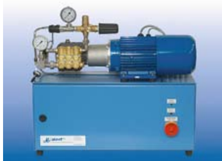
B-four – Hochdruck-Zerstäuber-System für die direkte Raumbefeuchtung sowie für die Anwendung in Zuluftkanälen und Monoblickpumpe für vielfältige Anwendungen.