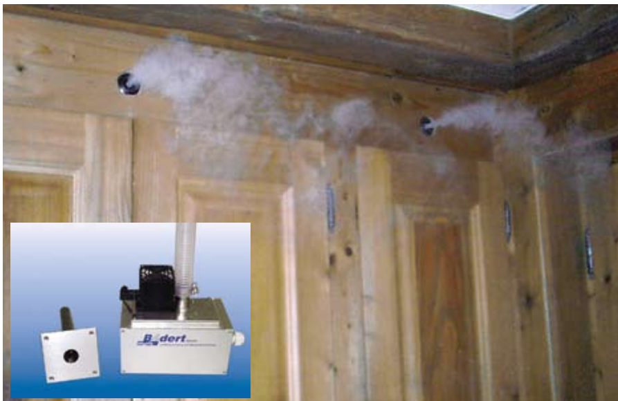
Beispiel einer B-home Anwendung, des vollautomatischen Luftbefeuchtungssystems auf der Basis von Ultraschall.

Stolz ist der Geschäftsführer auch auf das firmeneigene Serviceteam. Was zeichnet dieses aus seiner Sicht aus? «Die Kompetenz sowie möglichst rasche Störungsbehebungen stehen an erster Stelle. Alle un-