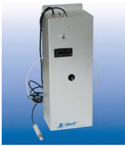
B-vino – kompakter Ultraschallbefeuchter speziell für Weinkeller entwickelt.

Sere Servicetechniker sind zudem nach den VDI/SWKI Richtlinien geprüft und ausgezeichnet. Dank einem grossen Ersatzteillaager ist daher bei Störungen oder Schäden überdies jederzeit ein schneller Materialaustausch gewährleistet. Ferner sind unsere Mitarbeiter spezifisch auf allen Befeuchtungs- und Wasseraufbereitungssystemen sowie auf der Regelungs- und Lüftungstechnik ausgebildet», nennt er die Pluspunkte. Deshalb werden die Geräte und Systeme auch zum grössten Teil mit einer eigenen Montage-Equipe installiert. Und die Inbetriebnahme der Anlagen erfolgt immer durch einen Servicetechniker des Unternehmens.