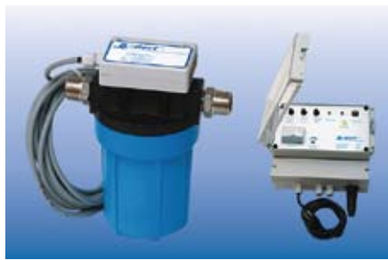
B-silver – SPS-gesteuerte Wasserentkeimungsanlage die der Entwicklung von Mikroorganismen entgegenwirkt.

Info-Telefon: 071 313 99 22 info@tca.ch www.tca.ch